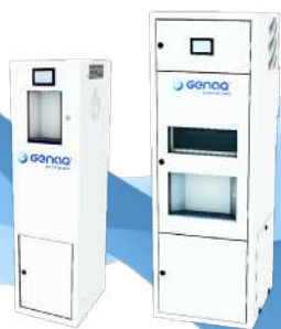
STRATUS S200 200 litros/día