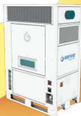
NIMBUS N500 500 litros/día

Sitios en construcción, minas, plataformas petrolíferas, ubicaciones remotas, etc.