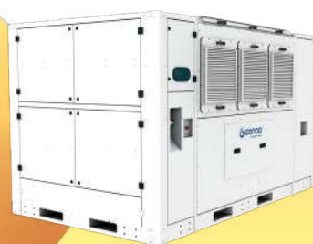
NIMBUS N4500 4.500 litros/día