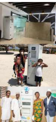
STRATUS S50 50 litros/día