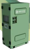
CUMULUS C50 50 litros/día